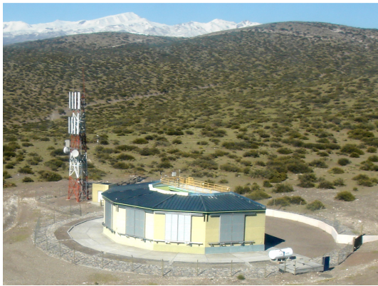
Observatorium, Pampa und Anden

Die Erde ist einem andauernden Strom kosmischer Teilchen-Strahlung ausgesetzt. Sie besteht hauptsächlich Protonen, aber auch aus schwereren Atomkernen. Die Quelle dieser Strahlung sind beispielsweise die Sonne oder Sternexplosionen. Die energiereichste kosmischen Strahlung – 100 Mal stärker als die Strahlung in Teilchenbeschleunigern – wird seit etwa 4 Jahren mit Hilfe des Auger-Observatoriums in der menschenleeren Pampa Amarilla in Argentinien untersucht. Dort befinden sich in einem Messfeld von der Größe des Saarlandes (3000 km 2 ) 1600 Wassertanks (12 m 3 reines Wasser) mit Detektoren sowie 24 optische Teleskope.