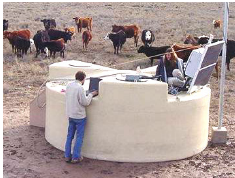
Einer von 1600 Detektoren

Die Forscher vermuten jedoch, dass sie noch etwa 10 Jahre messen müssen, um den Ursprung der Teilchen klären zu können. Bericht: Heinz Holz