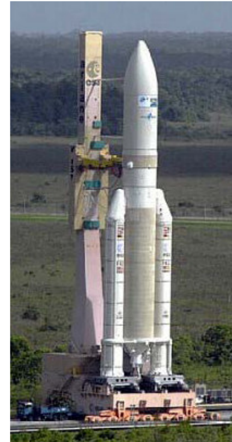
Auf transportablem Abschusstisch

Weblink (auch Filme über Raketenstarts!): http://www.arianespace.com